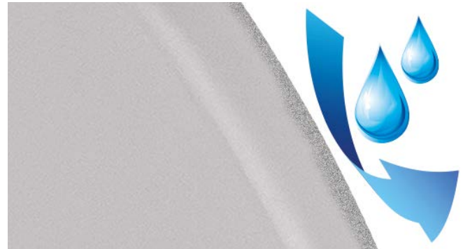
MŰANYAG EASY-CLEAN KEZELÉSSEL