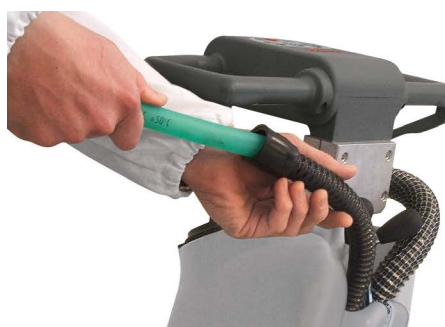
Vispa 35 B-BS

A szívószűrő egyszerű és praktikus alapos tisztítása