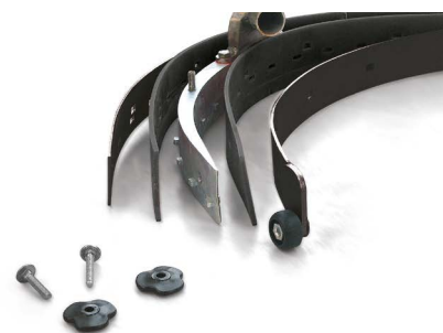
Vispa 35 E-B-BS

A gumibetét tömlőjének rendszeres tisztítása a hatékony szívás érdekében