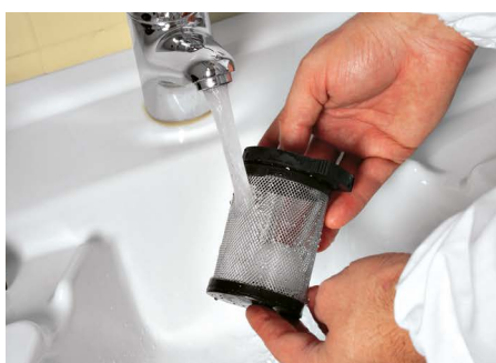
Vispa 35 E-B-BS

A szívószűrő egyszerű és praktikus alapos tisztítása